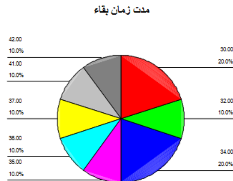
نمودار ۲- مدت زمان بقاء در گروه ۴ (گروه پلاسبیو)